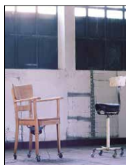
KUNST UND KÜNSTLER IN DER REGION

Seit über 18 Jahren erscheint curt (fast) monatlich. Mit dem prägnanten Formatwechsel auf A5 quer und der inhaltlich neuen, kulturellen Ausrichtung ist in den letzten ein, zwei Jahren ein Imagewandel geglückt, der curt nun auch in der Hochkultur zu einem richtungweisenden und zentralen Sprachrohr für die Kultur- und Kreativwirtschaft macht. Im Dezember 2015 erschien unsere 200. Ausgabe!