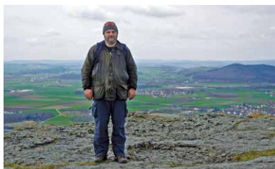
UNSER REDAKTIONSTEAM: AUSGEZEICHNET!